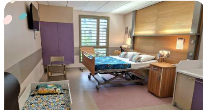
Suite parentale / famille

La clinique propose en plus de ses chambres individuelles classiques deux chambres Premium, ainsi que deux à trois suites Parentales . Les suites parentales sont composées d'un lit 2 places, et peuvent accueillir sous condition un enfant de moins de 6 ans, sous la responsabilité du coparent = chambre famille (selon disponibilité - tarifs journaliers sur demande).